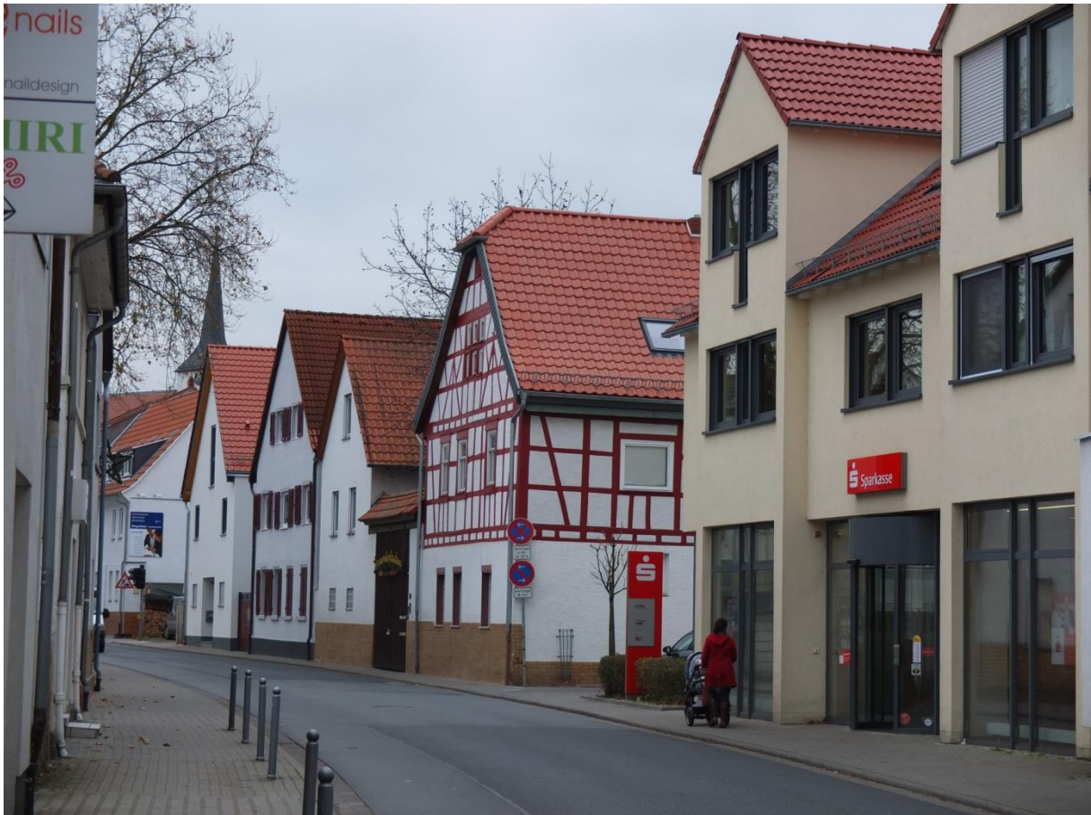
Typische Bebauung Darmstädter Straße

Das bereits zuvor zu sehende Luftbild zeigt dreidimensional die Baumasse mit dem Anschluss an die denkmalgeschützten Gebäude Darmstädter Straße 14 und Steingasse 2-4. Die Baumasse ist nicht nur insgesamt völlig unangemessen, sie fügt sich insbesondere auch in keiner Weise an die wesentlich niedrigere angrenzende denkmalgeschützte Bebauung an.